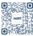
碩士課程學習計劃