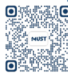
博士課程學習計劃

註：1. 各課程的簡介及學習計劃詳情，請查閱大學網站學院 / 研究所之介紹。 2. 倘課程 / 專業修讀人數不足，大學可決定取消開辦該課程 / 專業。