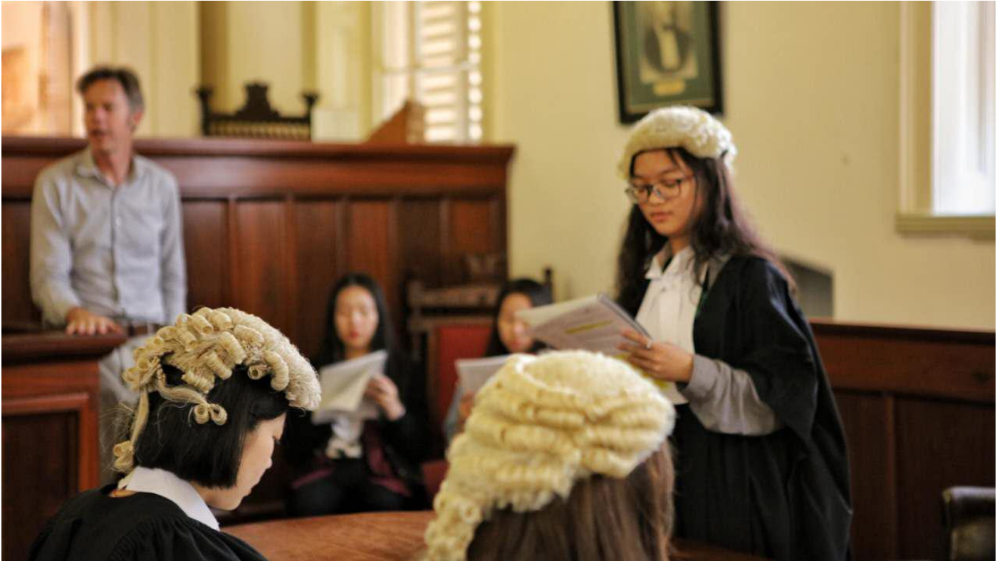
法律博物馆-模拟法庭 Role-Play