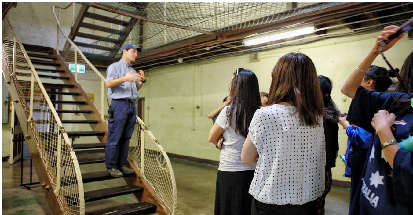
历史遗迹——弗莱曼特监狱

另外，在天气良好的情况下，学校会在周末组织海豚中心一日考察，让同学们坐船去看海豚呢！