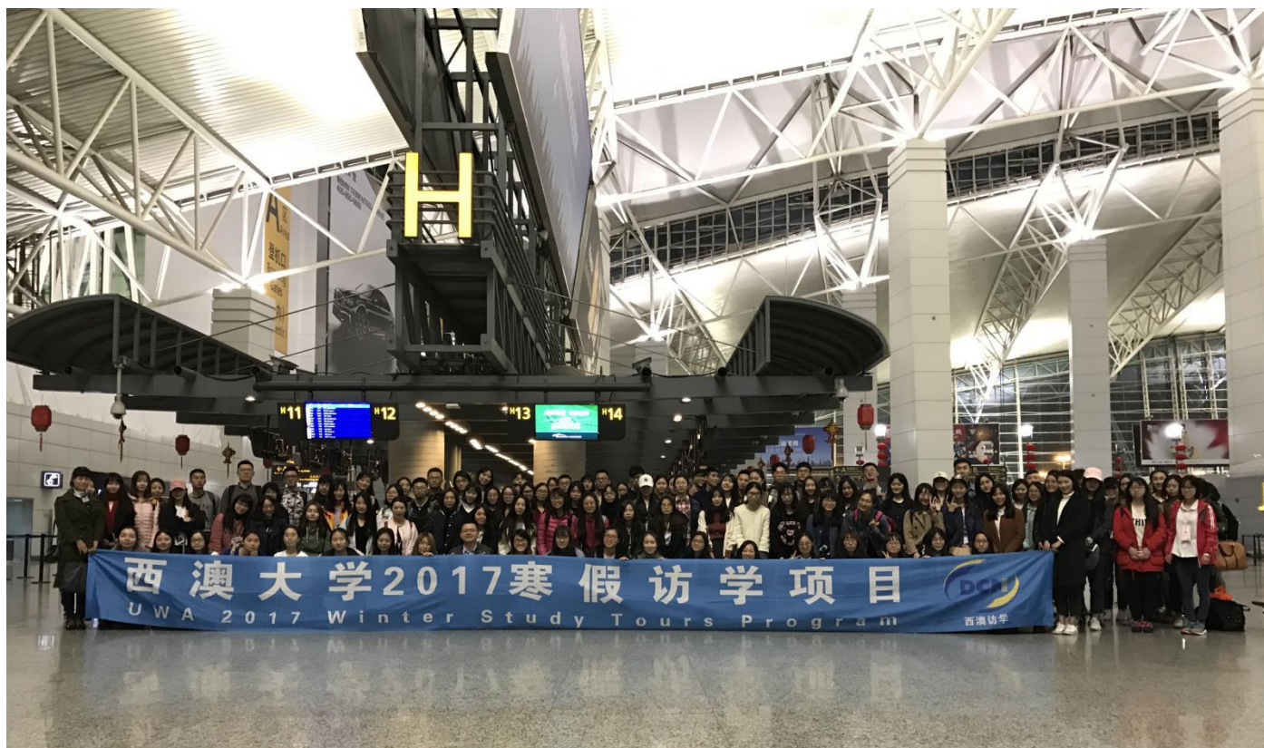
西澳大学 2017 寒假访学学生合影