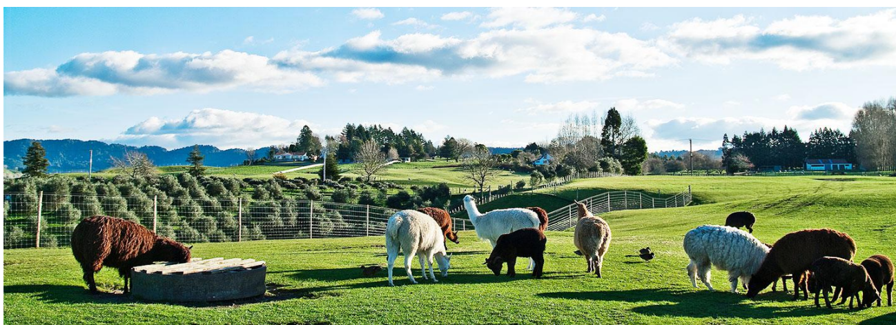
澳大利亚当地农场