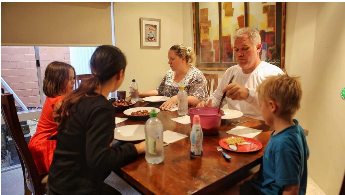
和当地人相处，体验澳洲地道生活