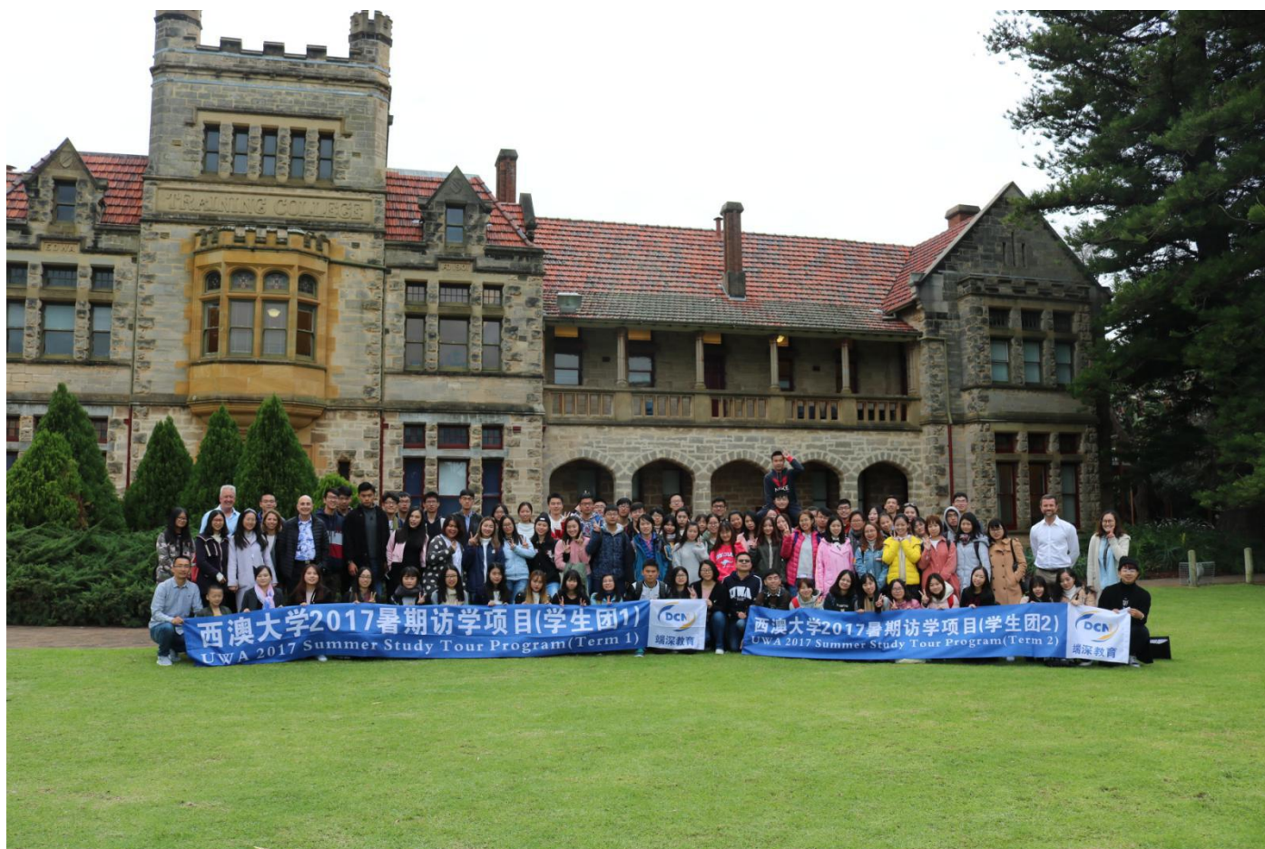
西澳大学 2017 暑期访学学生合影