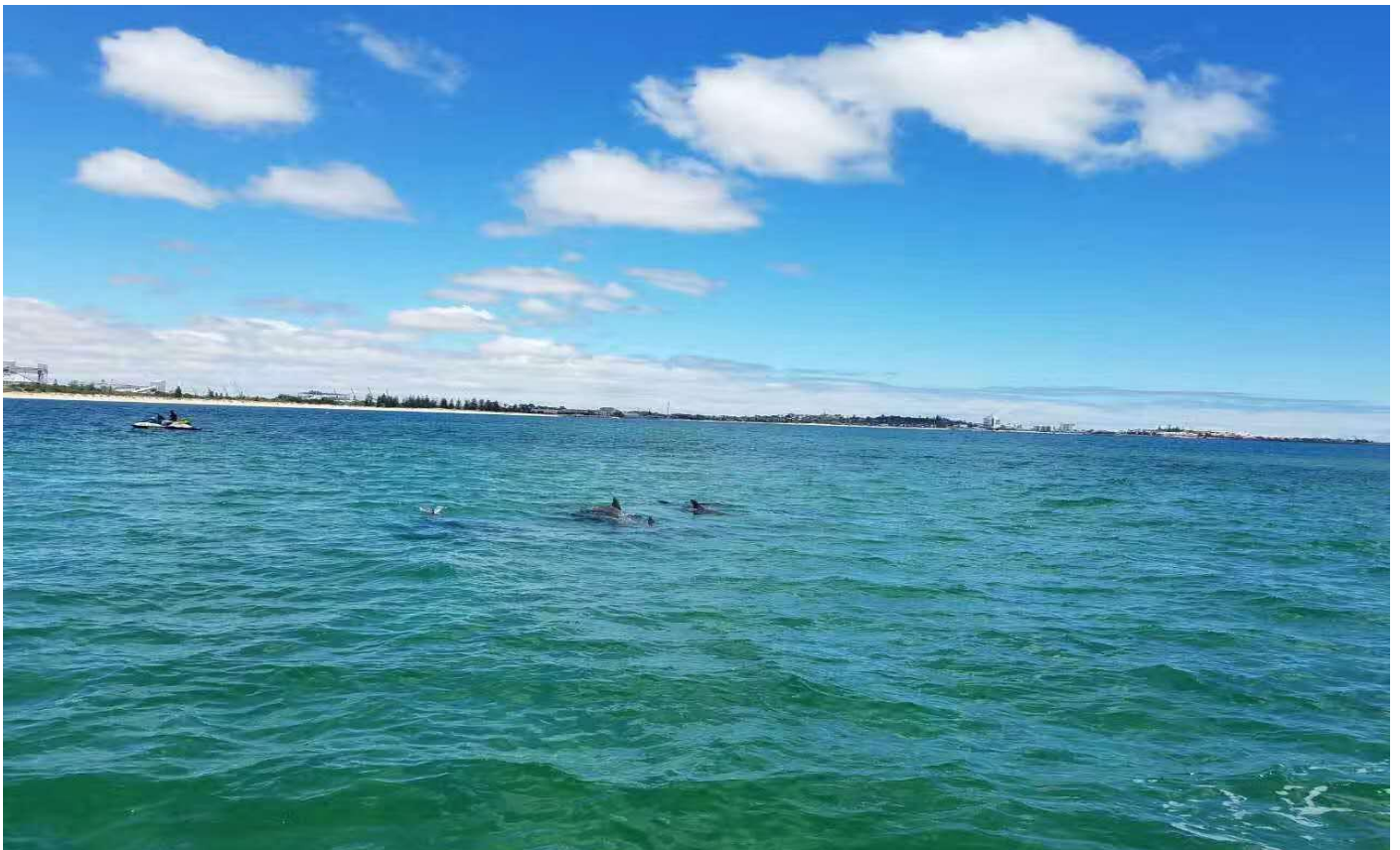
海豚中心一日考察