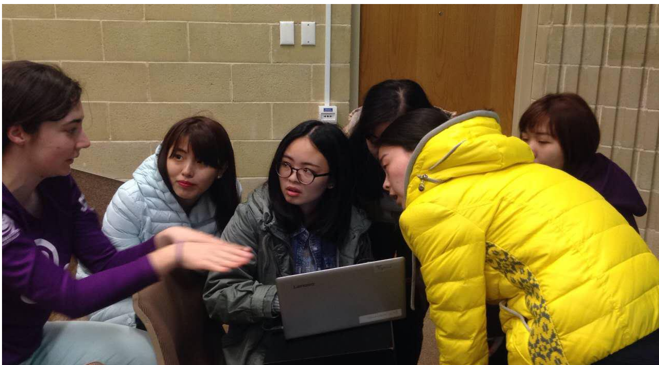
本校学生讲解机器人原理