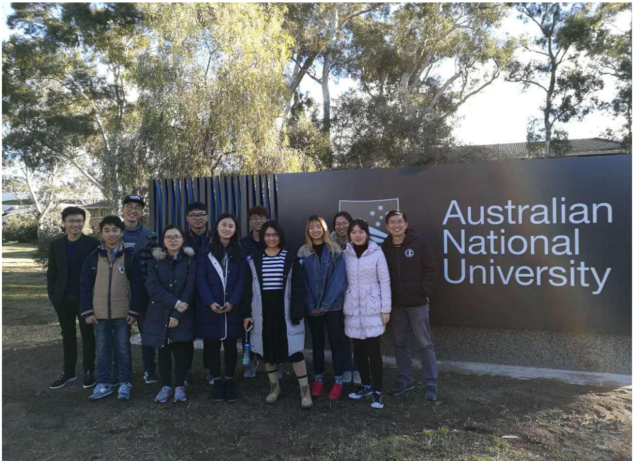
澳大利亚国立大学