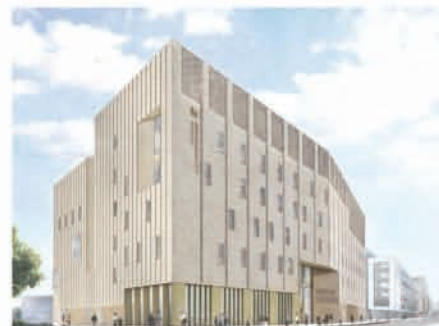
▲ Artist's impression of the new Conservatoire building