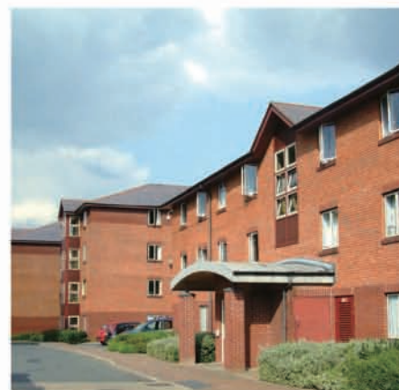
▲ Oscott Gardens

更多更新信息请访问我们的网站： www.bcu.ac.uk/international/after-acceptance/apply-for-accommodation-for-more-information